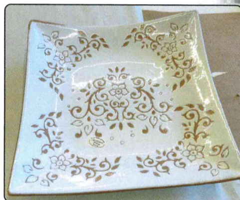
Premio concesso da BELLEGIANO Tiberio

Presso Biblioteca Comunale Piazza del Popolo - SAN PIETRO IN LAMA (LE) info 327. 8995857 - Orario dalle 18,30 alle 20,30